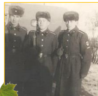
Курсанты Тюменского высшего военного училища. Выпускники

В 1973 году состоялся ещё выпуск из 11 класса в количестве 6 человек (вечерняя школа).