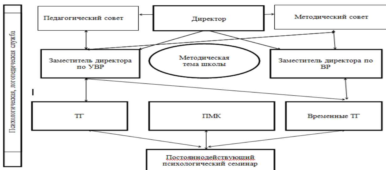
Схема: Организация учебно-методической работы

Структура методической службы в школе –отлаженный механизм. Он позволяет работать с хорошей отдачей, способствует реализации образовательных программ всех ступеней образования, развивать, в том числе и творческие способности педагогов.